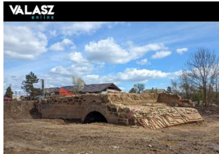
Szemétdomb alól került elő a hortobágyi Kilenclyukú híd kistestvére