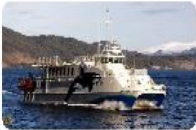
"The Eco Queen" – a tool and example