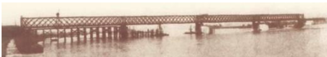
A híd szerelési munkálatai 1876-ban

1945. március 25-én nyílt meg a forgalom számára az ideiglenesen kijavított Déli vasúti összekötő híd, amelyet eredetileg 1877-ben adtak át a forgalomnak.