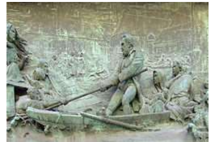
Wesselényi Miklós az árvízi hajós, aki életeket mentett

1838. március 13-án érte el Pest városát a jeges árvíz első hulláma. A hatalmas víztömeg mintegy 20 km szélességben mindent elpusztított. Az árvíz által kioltott 153 emberéletből 151 pesti lakosé volt. A város házainak fele összedőlt, vagy megsérült.